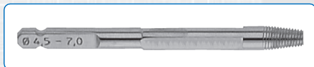
Extracteurs coniques tourne-à-gauche Ø1,5 à 2,0 - Ø2,7 à Ø4,0 - Ø4,5 à Ø7,0

Une solution simple et compacte pour l'extraction des vis cassées ou endommagées, de Ø1,5mm à Ø7,0mm