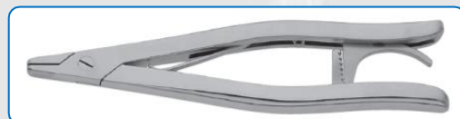
Davier - Longueur 205mm